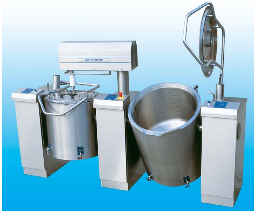
Den modulopbyggede produktion muliggør skræddersyede løsninger til hver enkelt kunde

projektet, sammen med nøgleskemaet for styringen. Skal der også et røreværk med, kopieres et hovedstrømsskema samt et nøgleskema for røreværkets styring med over i projektet. Sådan bliver vi ved indtil alle de ønskede moduler er kopieret ind. Ønsker kunden f.eks. ikke en indbygget arbejdsafbryder, går vi ind på skemaet og fjerner den på et øjeblik. Herefter får vi indholdsfortegnelsen og styklisterne opdateret automatisk. Denne opdatering tager også højde for de eventuelle rettelser, der er foretaget, og stemmer 100% overens med den specielle kombination kunden har valgt. Udfærdigelsen af denne komplette dokumentation klarer på blot 5-10 minutter i vores nye el-dokumentations program, PCSchematic ELautomation. En sådan fleksibilitet kunne vores konstruktions-CAD på ingen måde give os.”